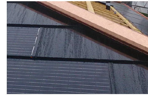
Foto mit überstehenden Grat