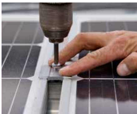
Einfache und zuverlässige Montage

Insgesamt sind nur vier Komponenten für eine schnelle und einfache Montage nötig.