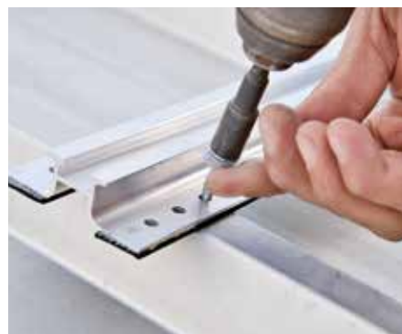
Das Zuschneiden vor Ort oder Bohrarbeiten sind nicht notwendig.