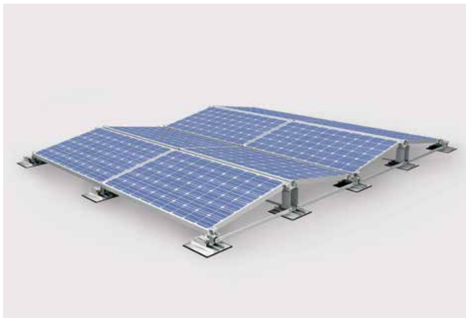
Schnelle Vormontage spart Arbeitsschritte beim Aufbau.