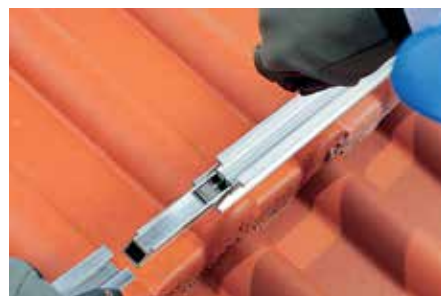
Werkzeuglose Montage des Schienenverbinders ohne Verschraubung.