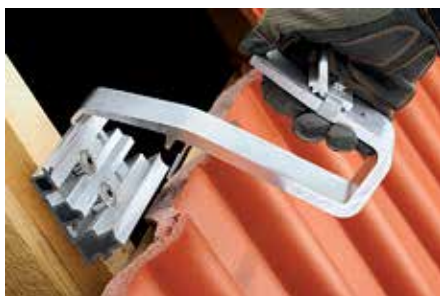
Einfache und schnelle Montage durch Klick-In System.