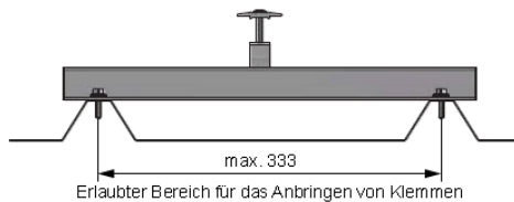
Abbildung 2: Klemmbereich auf Trapezschiene

Maximaler Sicken-Abstand: s_{\max} = 333 \text{ mm}