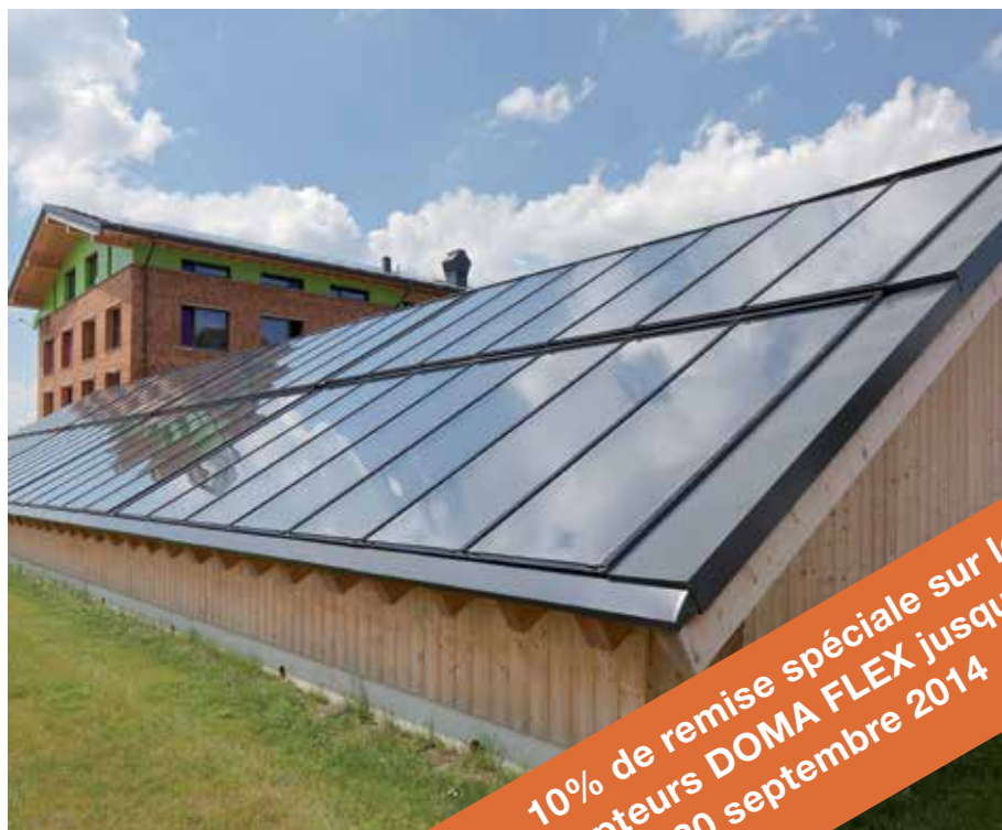
Toiture complète avec capteurs DOMA FLEX grande surface

10% de remise spéciale sur les capteurs DOMA FLEX jusqu'au 30 septembre 2014