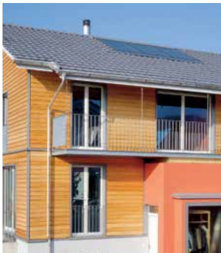
Exemple typique d'une installation Solar Compactline avec deux à trois capteurs solaires intégrés au toit et un chauffe-eau en sous-sol.

Grâce à la forme de construction et les composants harmonisés façon optimale, le système prêt à raccorder peut être planifié, proposé et installé à des frais minimaux.