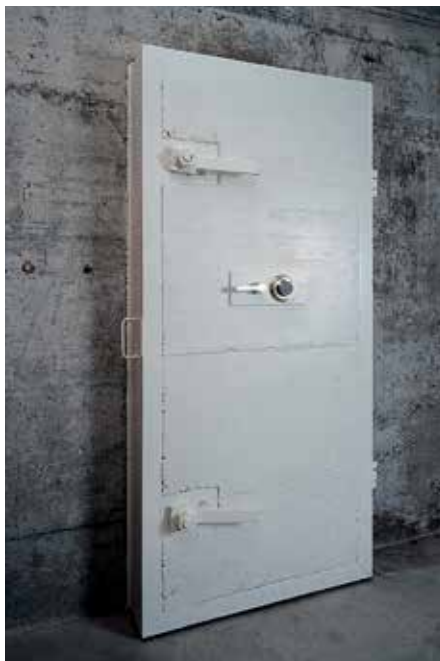
Panzertür: Widerstandsfähig und einfach im Handling

*ENV 1627, 1628 + 1630: Widerstandsklasse 6