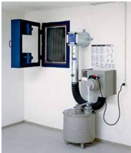
Spielt in geschlossenen Räumen eine wichtige Rolle: Kleinbelüftungsanlage.

Die Kleinbelüftungsanlagen VA 40, 75 und 150 sind für den kombinierten Hand- und Motorbetrieb konzipiert und erfüllen die geltenden BZS-Vorschriften.