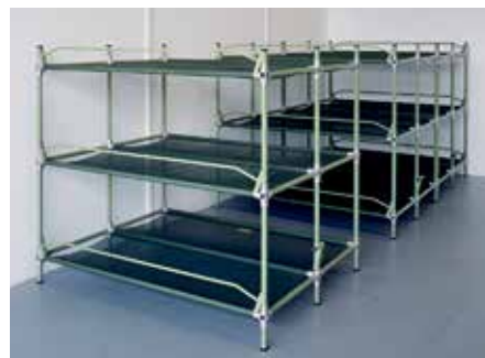
Liegestellen mit Tuchbespannung

Die Liegestellen entsprechen den Anforderungen des BZS und sind für die Ausstattung von privaten und öffentlichen Schutzräumen bestimmt. Liegestellen mit Holztablaren können als günstige Kellergestelle verwendet, solche mit Tuchbespannung hingegen platzsparend gelagert werden. Abortkabinen und Trockenklosett runden schliesslich das Einrichtungs-Sortiment ab.