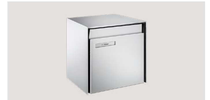
M30 H x L x P: 31 x 33 x 41 cm