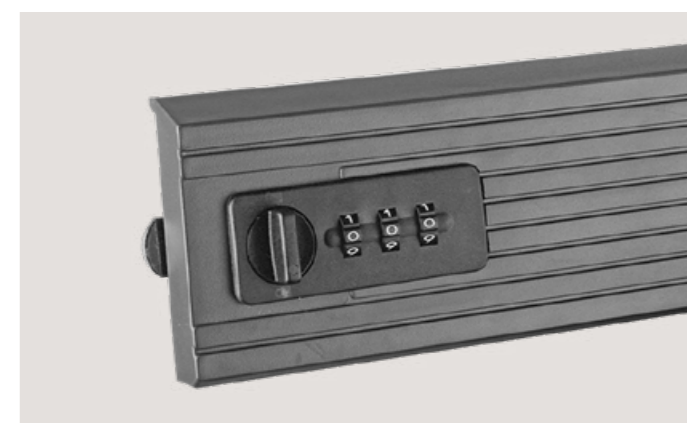
Serrure à combinaison