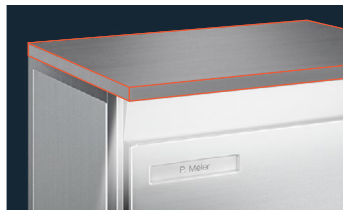
Module d'éclairage Seulement pour revêtement de profilé