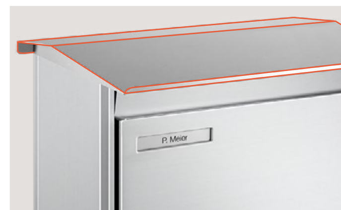
Auvent Seulement pour revêtement de profilé