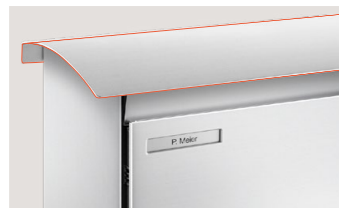
Auvent en arc Seulement pour revêtement simple