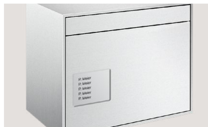
Profilé de porte avec module d'inscription