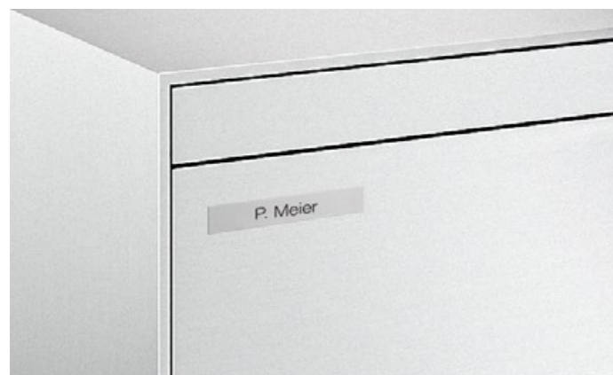
Profilé de porte