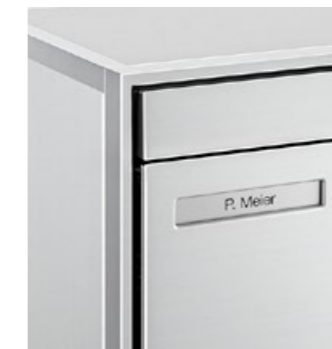
Volet d'introduction à surface affleurée