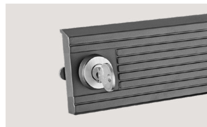
Cylindre fournit par le client Compatible avec les systèmes Kaba, KESO, SEA, IKON, DOM ix