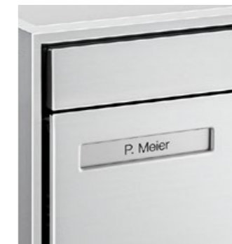
Plaquette nominative standard