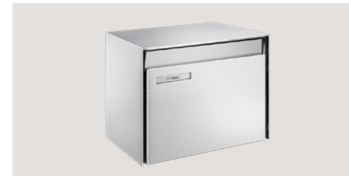
M40 H x L x P: 31 x 42 x 30 cm

Le design intemporel mise sur des lignes claires et une esthétique raffinée. Les boîtes aux lettres de Schweizer s'harmonisent donc parfaitement avec une architecture moderne mais aussi classique. Elles sont disponibles en deux tailles standard. De plus, il est possible d'adapter individuellement les profilés, les volets d'introduction et les plaquettes nominatives.