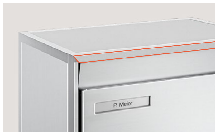
Gouttière antipluie Seulement pour revêtement de profilé