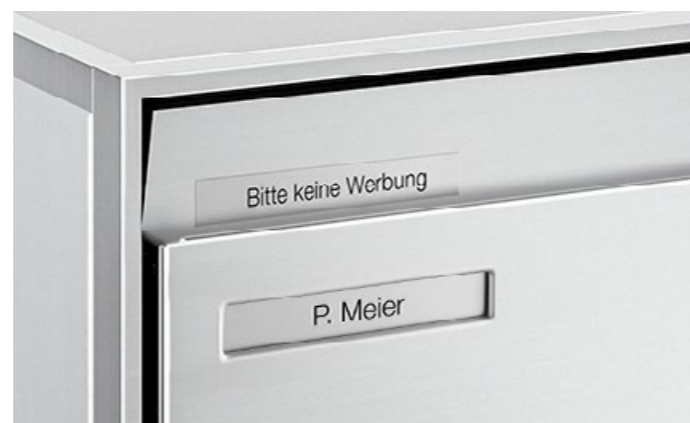
Plaque réversible «Pas de publicité»