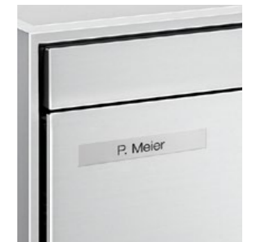
Plaquette nominative à surface affleurée