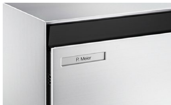
Volet d'introduction en noir ou revêtement par poudre en couleur