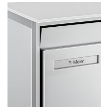
Volet d'introduction standard