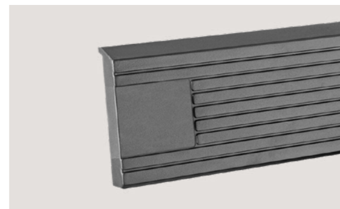
Système d'ouverture électronique