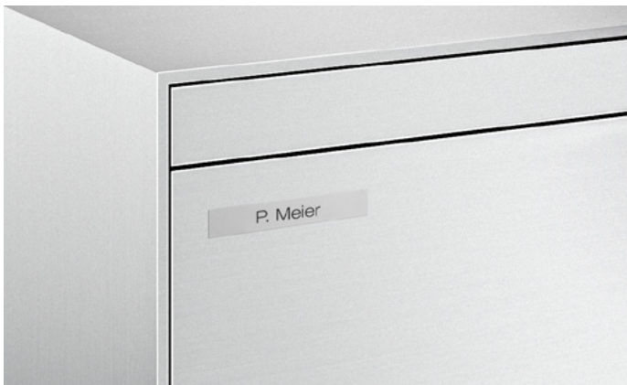
Profilé de porte