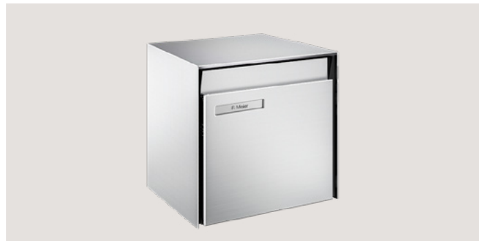
M30 H x L x P: env. 31 x 33 x 41 cm