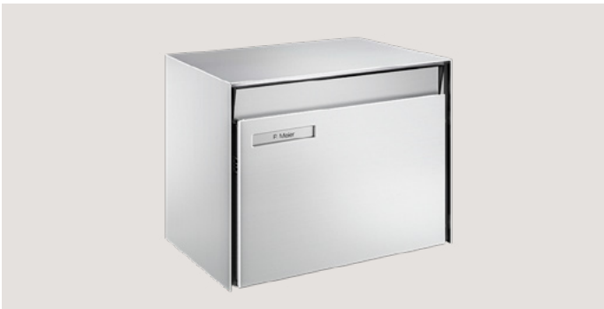
M40 H x L x P: env. 31 x 42 x 30 cm

Le design intemporel mise sur des lignes claires et une esthétique raffinée. Les boîtes aux lettres de Schweizer s'harmonisent donc parfaitement avec une architecture moderne mais aussi classique. Elles sont disponibles en deux tailles standard. De plus, il est possible d'adapter individuellement les profilés, les volets d'introduction et les plaquettes nominatives.