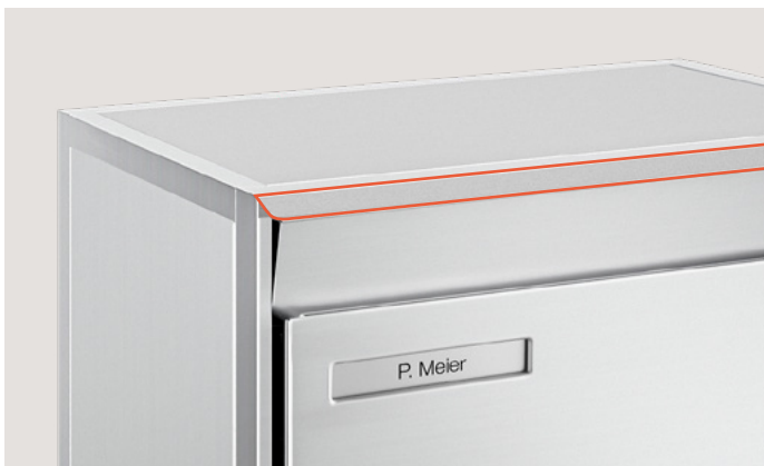
Gouttière antipluie Seulement pour revêtement de profilé