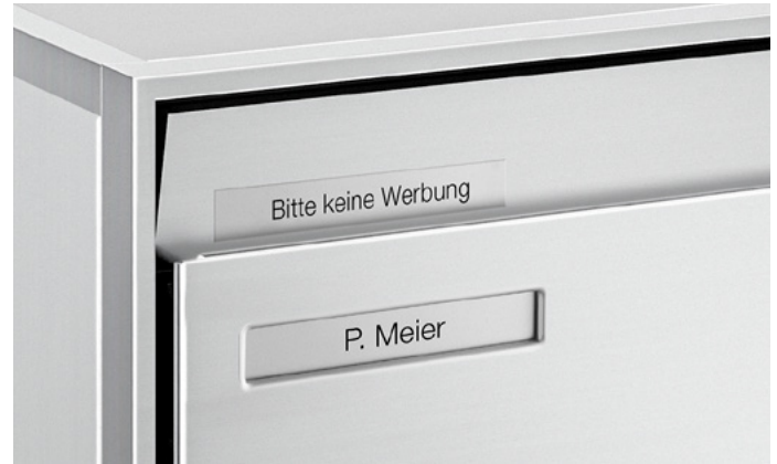
Plaque réversible «Pas de publicité»