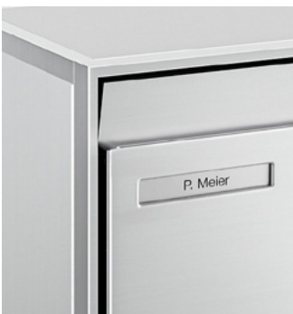
Volet d'introduction standard