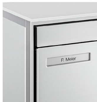
Volet d'introduction à surface affleurée