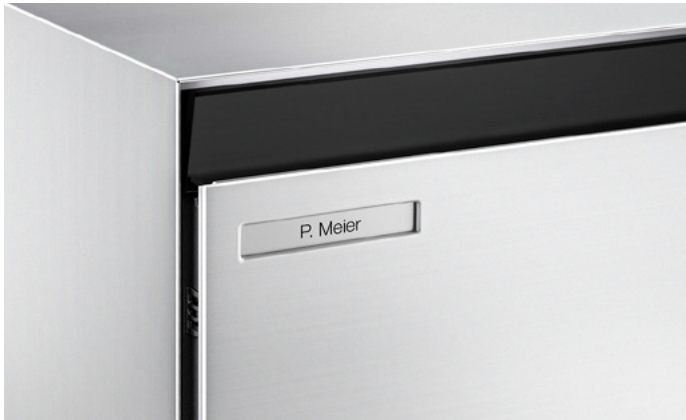
Volet d'introduction en noir ou revêtement par poudre en couleur