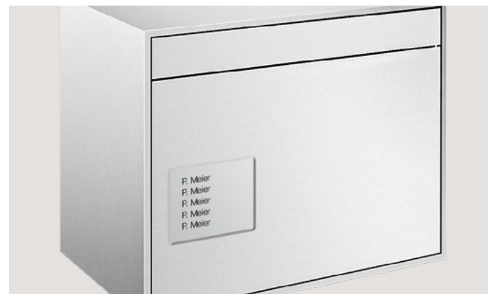
Profilé de porte avec module d'inscription