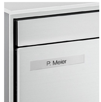
Plaquette nominative à surface affleurée