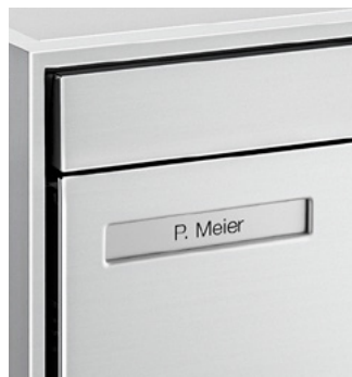
Plaquette nominative standard