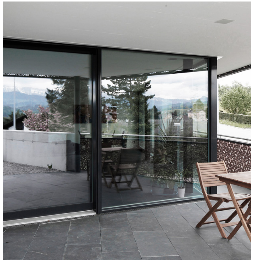
Mehrfamilienhaus Abtwil (Schweiz)