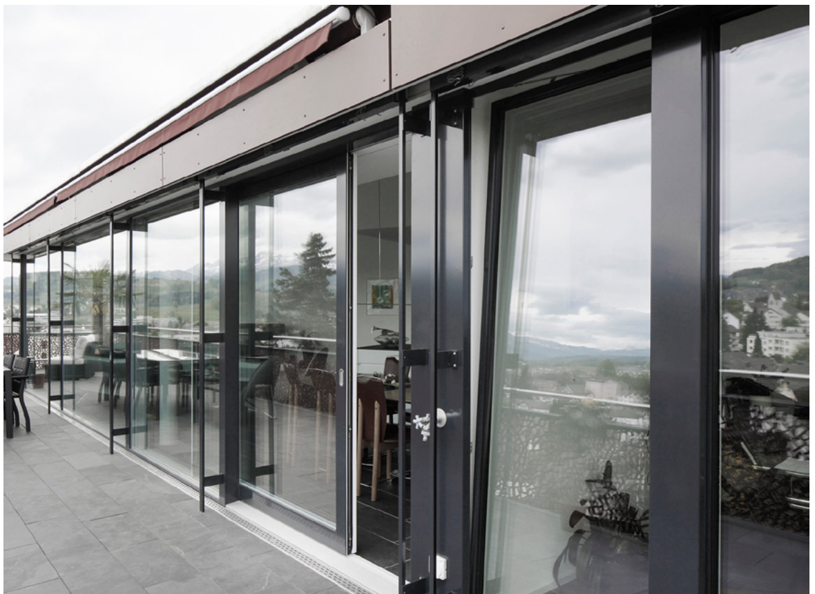
Mehrfamilienhaus Abtwil (Schweiz)