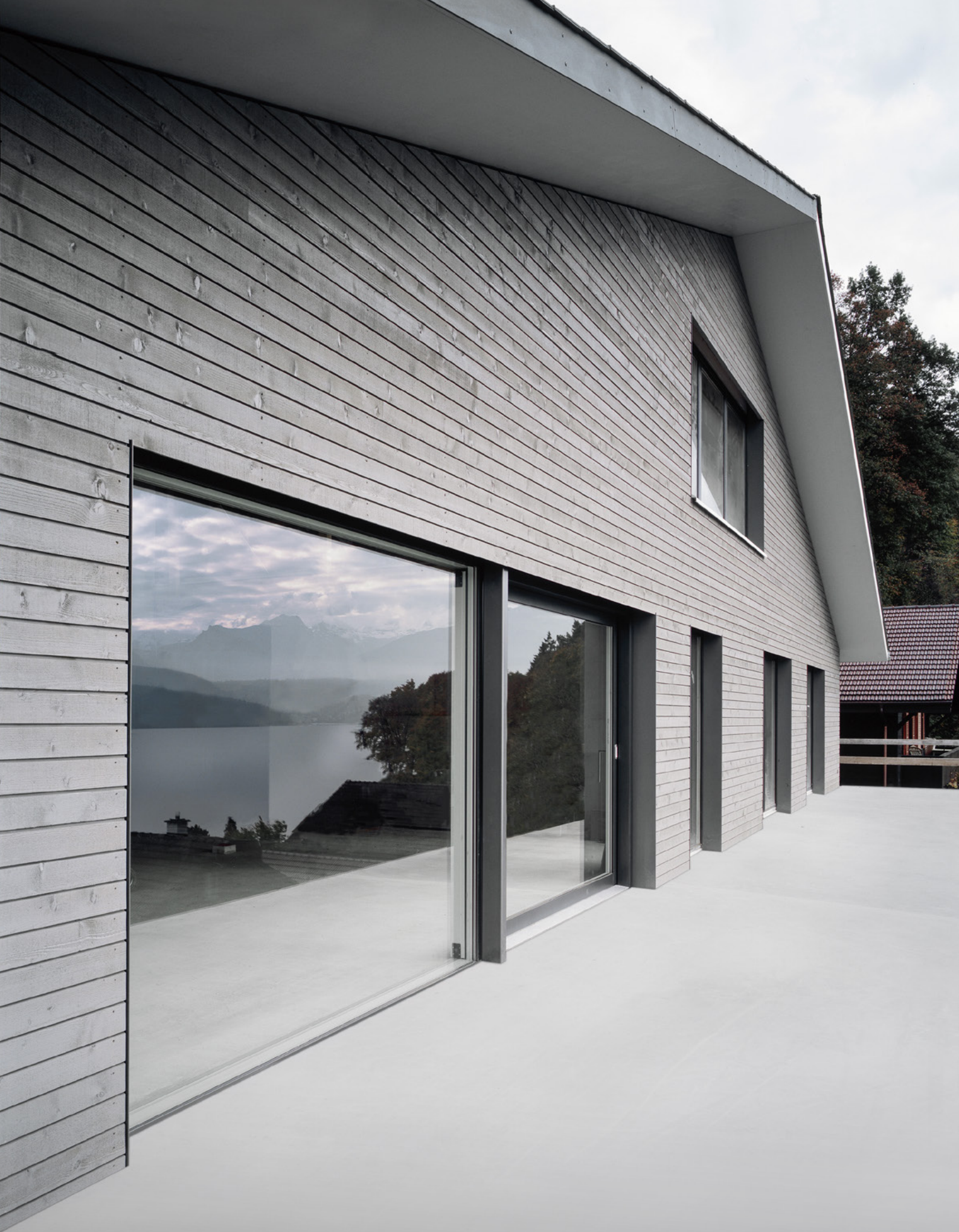
Einfamilienhaus Oberhofen (Schweiz)