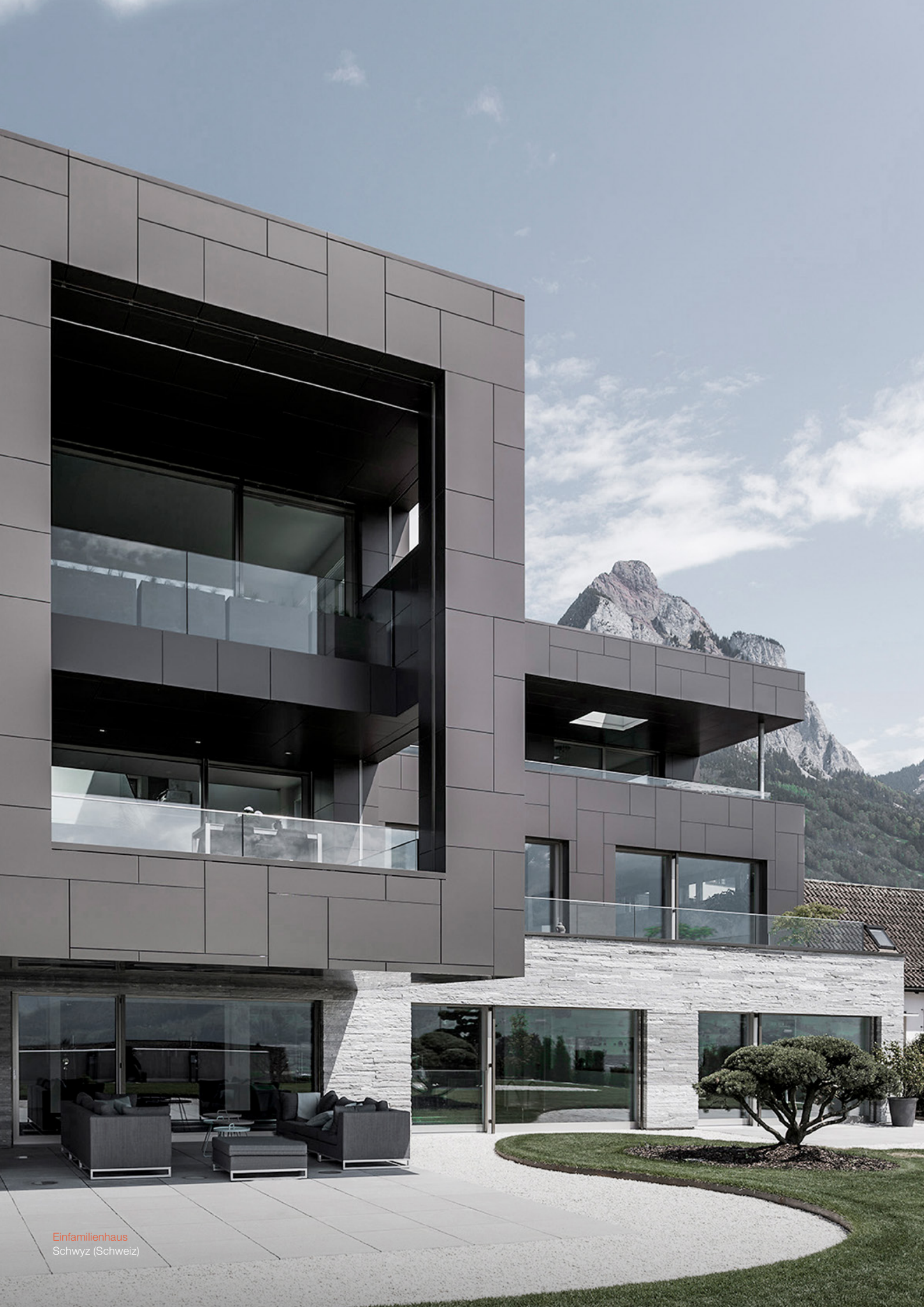
Einfamilienhaus Schwyz (Schweiz)