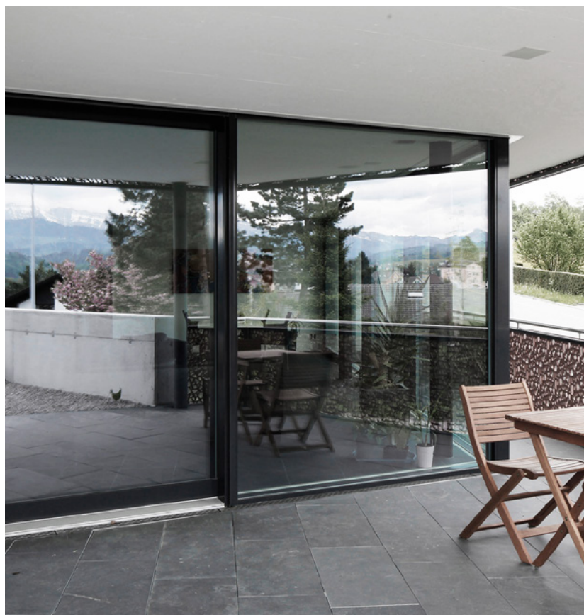
Immeuble résidentiel Abtwil (Suisse)