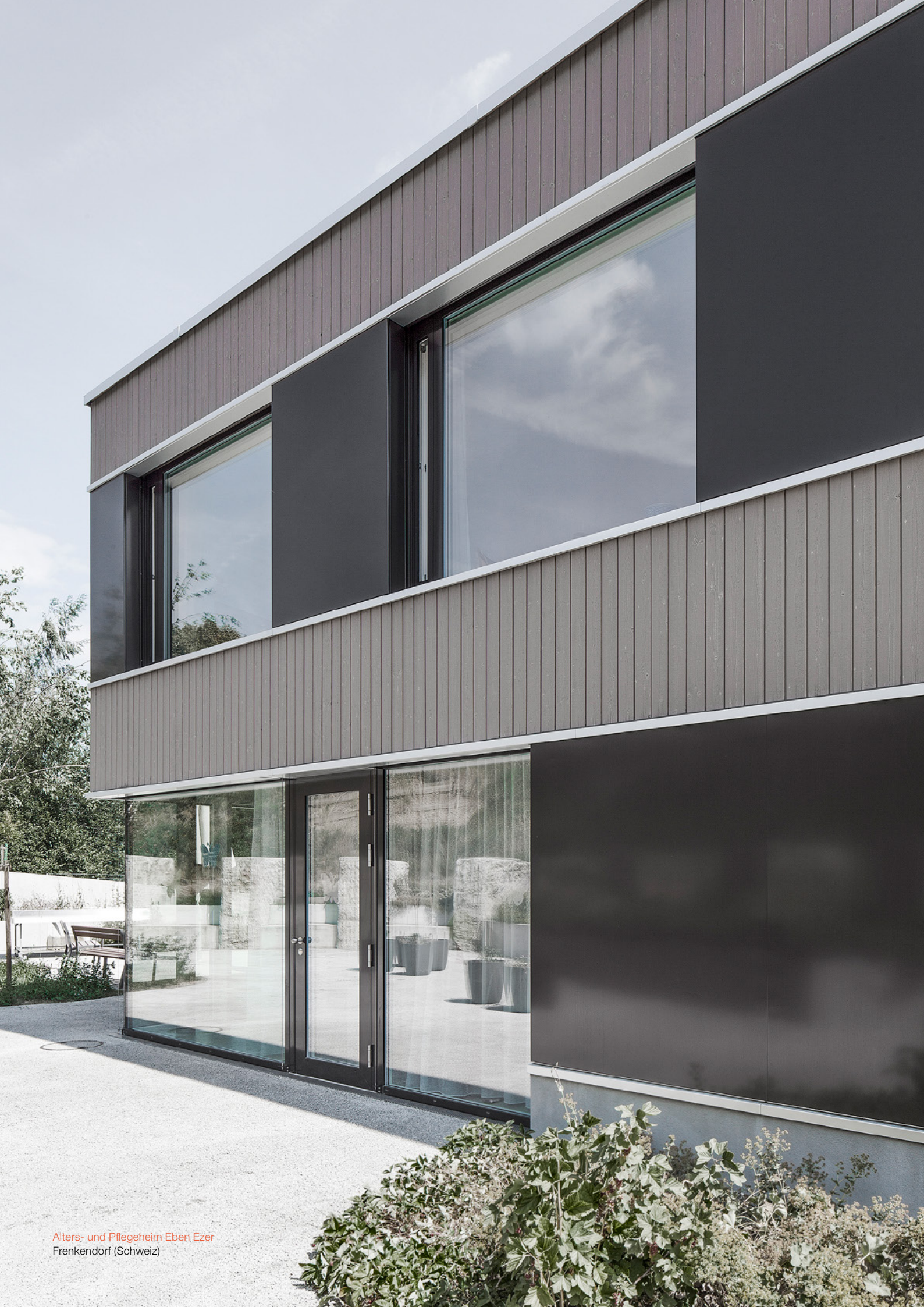
Alters- und Pflegeheim Eben Ezer Frenkendorf (Schweiz)