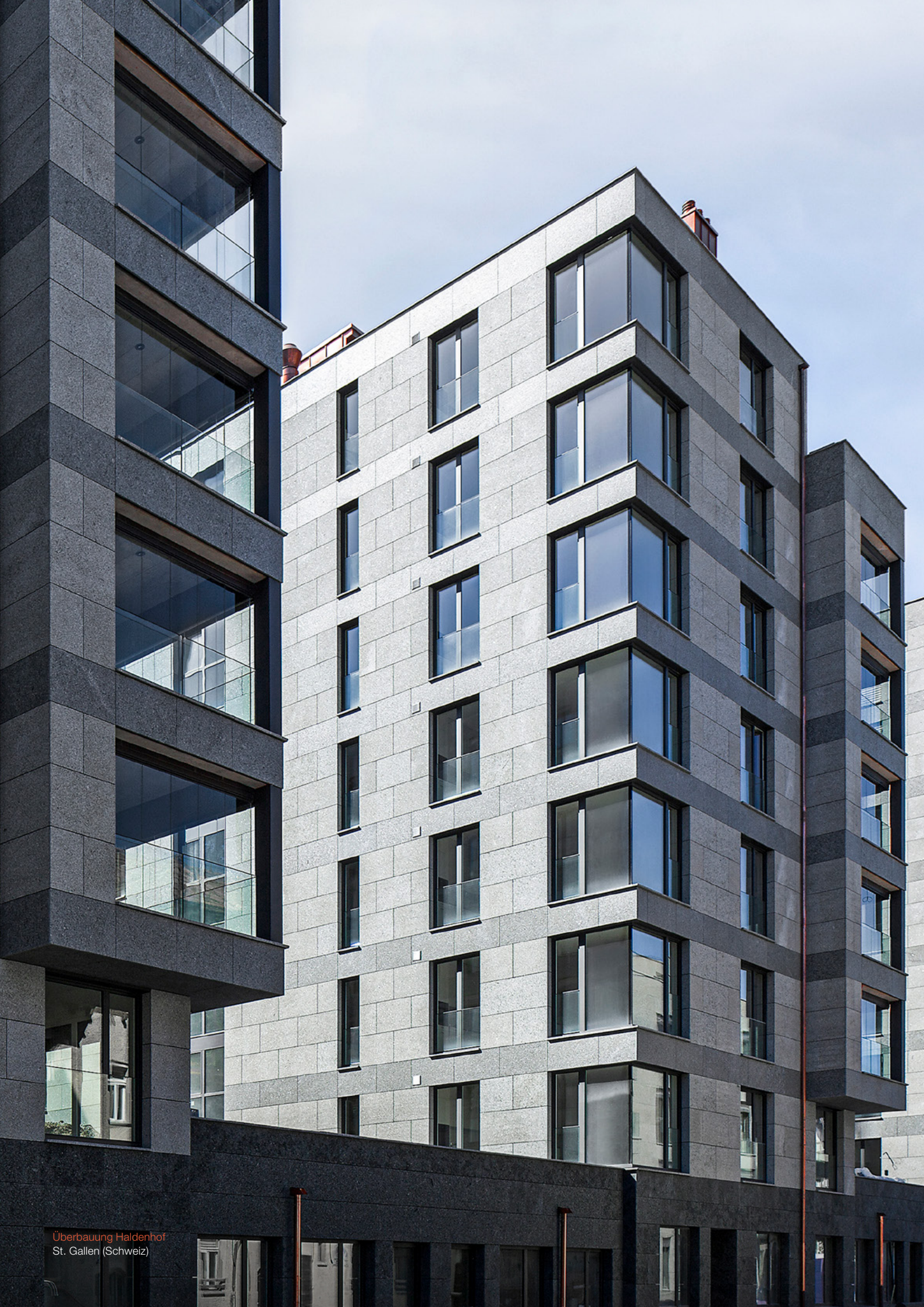
Überbauung Haldenhof St. Gallen (Schweiz)