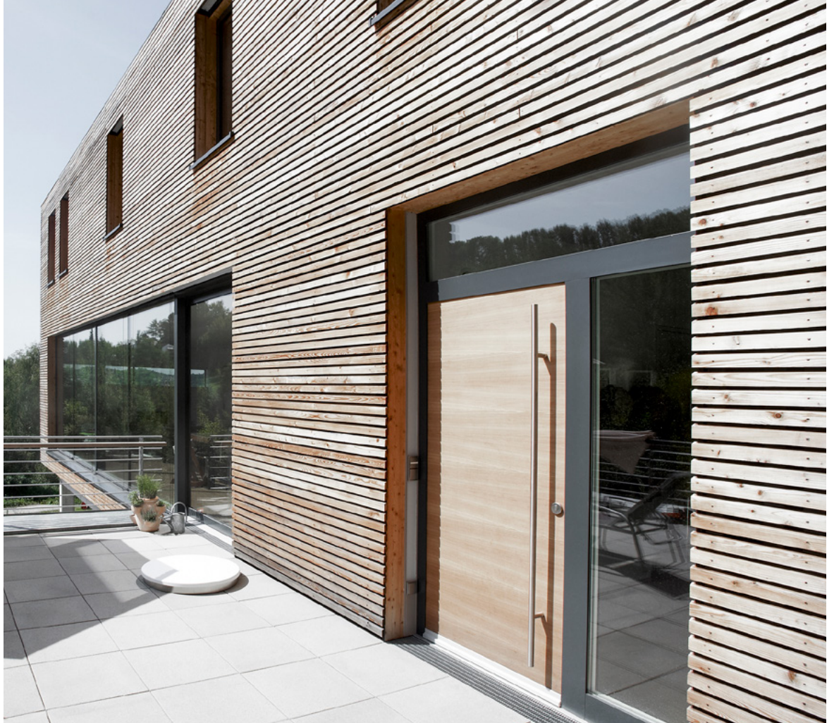
Einfamilienhaus Deggendorf (Deutschland)