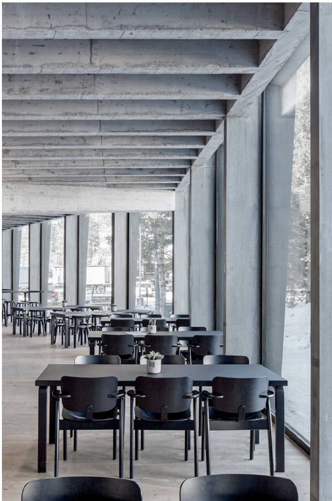
Eisstadion Vaillant Arena Davos (Schweiz)

Das Fenster- und Fassaden-System windura ist äusserst vielseitig. Von einzelnen Elementen über Fenstertüren bis zu grossflächigen Fensterbändern ist alles möglich – auch die Kombination verschiedener Anwendungen. Damit ist es für Neubauten ebenso wie für Sanierungen geeignet. windura ist in verschiedenen Varianten verfügbar.