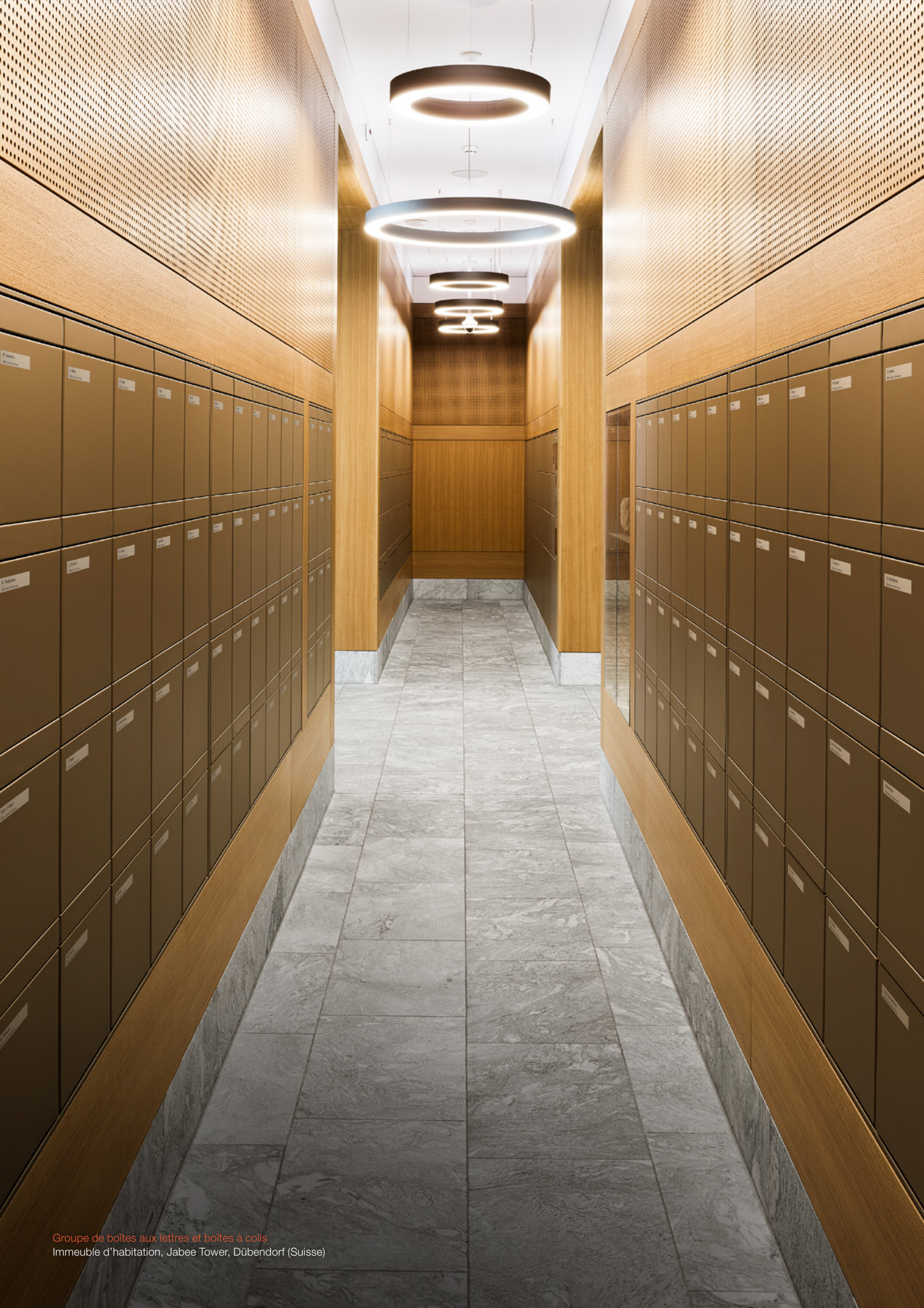
Groupe de boîtes aux lettres et boîtes à colis Immeuble d'habitation, Jabee Tower, Dübendorf (Suisse)