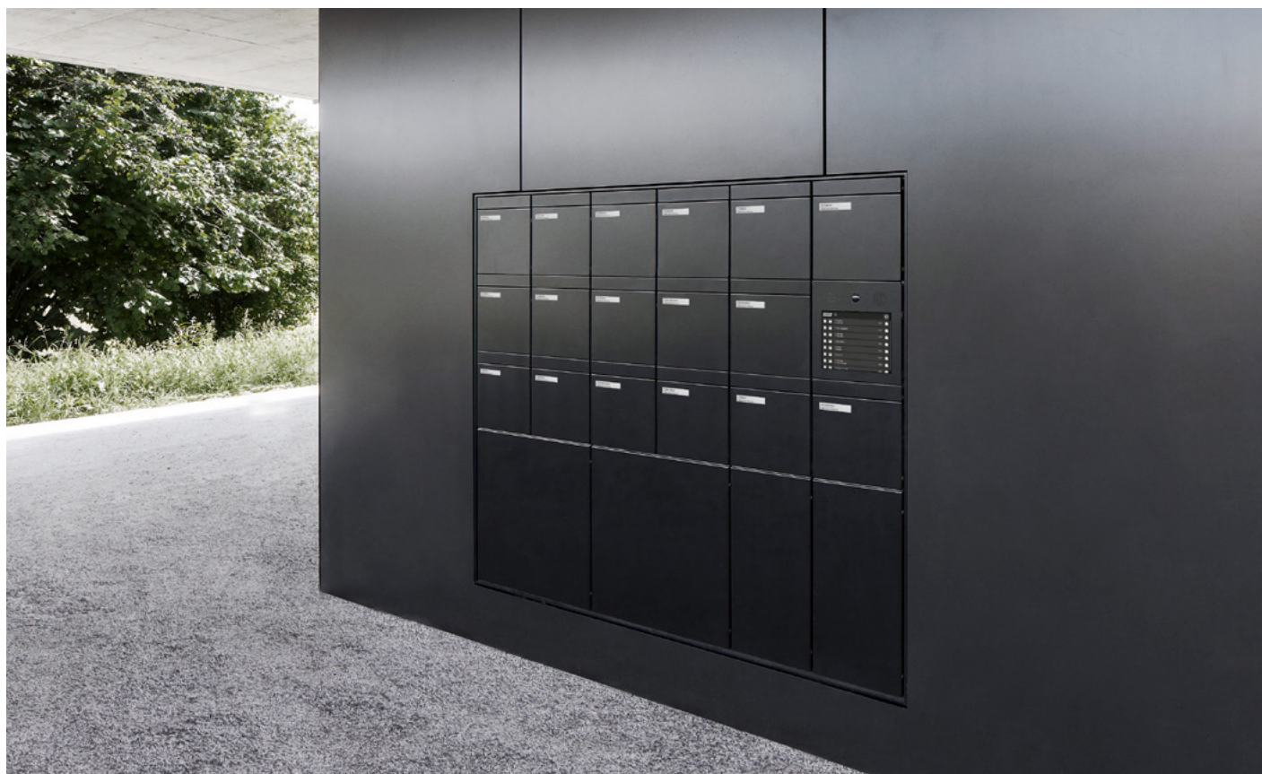
Boîte-à-colisPlus Immeuble d'habitation, Dübendorf (Suisse)