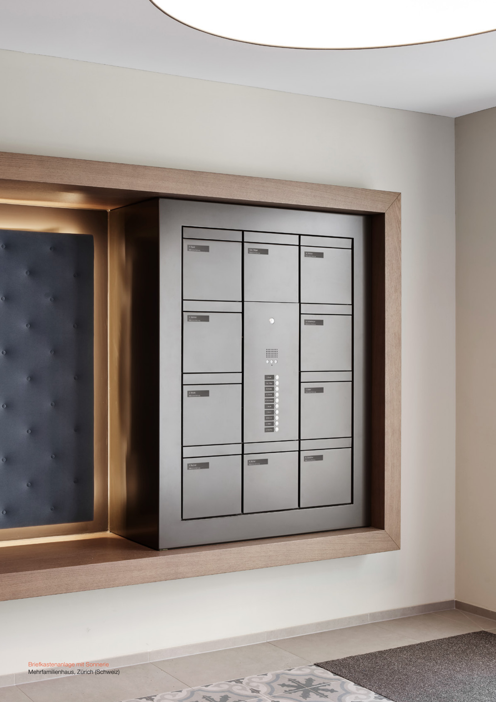
Briefkastenanlage mit Sonnerie Mehrfamilienhaus, Zürich (Schweiz)