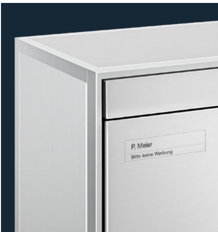
Briefkastenanlage mit Sonnerie Mehrfamilienhaus, Schattdorf (Schweiz)

Die neue eco-Linie – erhältlich als M30e und M40e